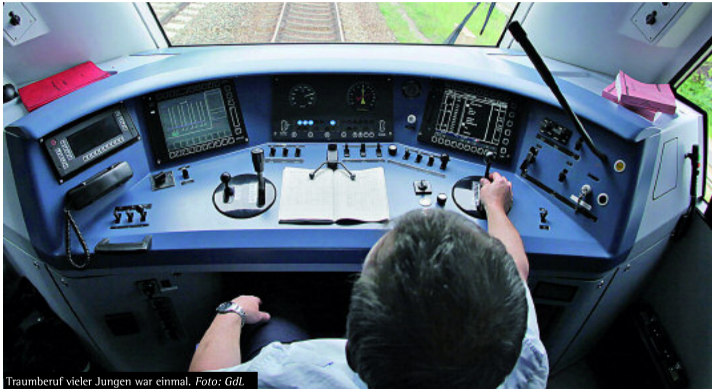
Traumberuf vieler Jungen war einmal.

Vor diesem Hintergrund darf es nicht verwundern, wenn die Forderung nach einer strikten Begrenzung der Überstundenzahl pro Jahr und nach einem Abbau